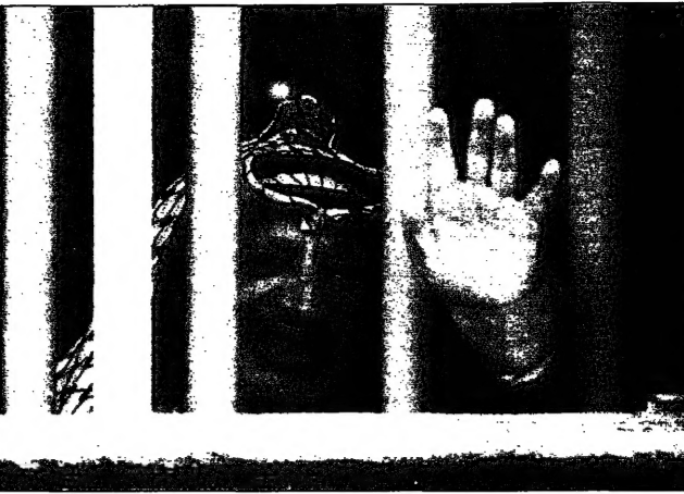
الرئيس عرفات يلوح من زنزانة التي عاش فيها مانديلا 19 عاما في سجن روبن آيلاند (روبنواي)

علاوة على ذلك، زيارته لبيت المقدس السابق في الزنزانة، وعاش عرفات في نفس الزنزانة التي عاش فيها مانديلا، وهو يردد عبارات من قبيل: «الشرق الأوسط في خطر» و«السلام في الشرق الأوسط لا يمكن تحقيقه إلا من خلال الحوار والتفاهل» و«السلام لا يمكن تحقيقه إلا من خلال الحوار والتفاهل» و«السلام لا يمكن تحقيقه إلا من خلال الحوار والتفاهل». وقال عرفات في خطابته التي ألقاها في السجن: «أنا في السجن منذ 19 عاما، وأنا أعيش في زنزانة صغيرة، وأنا أعيش في زنزانة صغيرة، وأنا أعيش في زنزانة صغيرة». وقال عرفات في خطابته التي ألقاها في السجن: «أنا في السجن منذ 19 عاما، وأنا أعيش في زنزانة صغيرة، وأنا أعيش في زنزانة صغيرة، وأنا أعيش في زنزانة صغيرة». وقال عرفات في خطابته التي ألقاها في السجن: «أنا في السجن منذ 19 عاما، وأنا أعيش في زنزانة صغيرة، وأنا أعيش في زنزانة صغيرة، وأنا أعيش في زنزانة صغيرة».